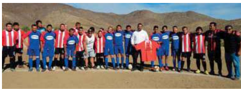
Son pocos, pero buenos los del deportivo Unión La Jarilla.