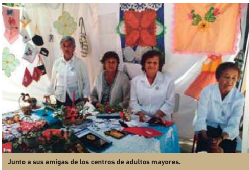
Junto a sus amigas de los centros de adultos mayores.

Además de conducir el programa de televisión, fue presidenta de la Unión Comunal del Adulto Mayor. "Y si hago un balance de lo que ha sido mi vida, sabiendo que nadie es cien por ciento feliz, me siento realizada. Lo mío ha sido trabajo, trabajo y trabajo. No me quejo, es lo que me gusta y lo que me tocó vivir".