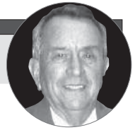
Por Juan Yttronic / ex-Gerente de Banco

No es complejo lograrlo, basta con una actitud firme que vaya bien acompañada del "Querer es Poder".