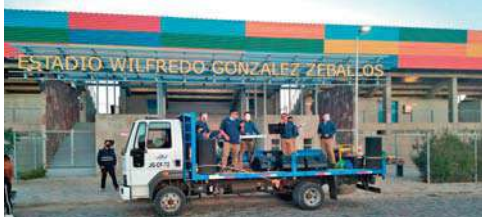
El grupo ADN Tropikal llevó alegría a los vecinos y alimentos a los más vulnerables.

En la jornada se reunieron alimentos no perecibles para ir en ayuda de los más necesitados.