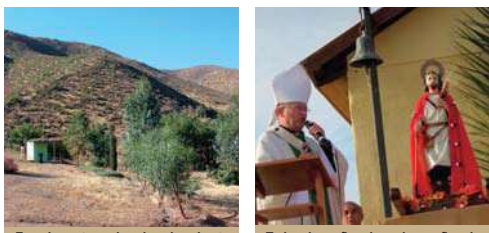
En el sector abunda el arbusto llamado Jarilla, que sirve para el dolor de estómago.