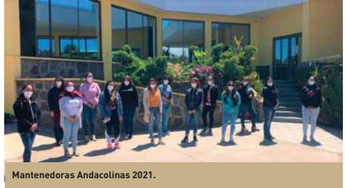
Mantenedoras Andacollinas 2021.

En esta oportunidad, postularon 351 personas y se realizaron más de 80 entrevistas. Luego de un exhaustivo proceso de selección y evaluaciones psicosociales y preocupacionales, se