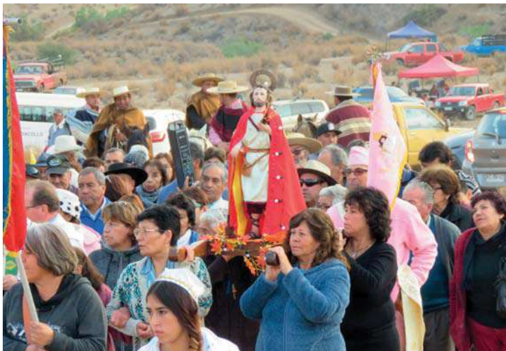
La procesión de la Fiesta de San Isidro que se celebra a fines del mes de mayo.

Esta comunidad agrícola está articulada en varios sectores, entre las que se pueden contar El Runco, Las Carditas, El Cabrito, El Azogue y La Jarilla, siendo este último el centro de la comunidad, pues ahí se ubica la sede social, la capilla y, por cierto, la cancha de fútbol.