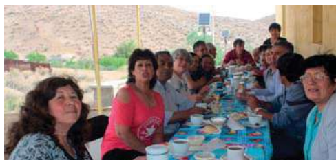
En la localidad siempre hay tiempo para encuentros entre vecinos.