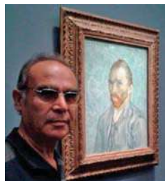
El maestro y el autorretrato de Van Gogh, en el Museo Orsay, París, donde están las obras originales del de este famoso pintor.

En la creación de canciones, ha destacado notablemente. El profesor ha escrito más de 120 composiciones de diversos géneros: folclóricas, tropicales y baladas, algunas de las cuales han sido grabada por solistas y conjuntos locales y de la región. Menciona aparte merecen las canciones religiosas, las que forman parte del repertorio que se interpretan en el Santuario y con las cuales se grabó un CD editado en 2016. También cuenta que sus composiciones más destacadas son el Himno del Colegio Parroquial, Música de Oración a la Virgen de Andacollo. Quiero verte Señor, Trapiche, Andacollo cotidiano y Vi sus ojos. "Comencé a componer muy joven y en diferentes géneros musicales. Por ejemplo, con una balada gané el Festival de la Canción Río Elqui de Vicuña, año 1970. Era el principal festival de la región", señala el maestro, quien agrega que el tiempo es oro, dicen por ahí. Por lo mismo, este profesor no descansa y eso queda reflejado en un pequeño