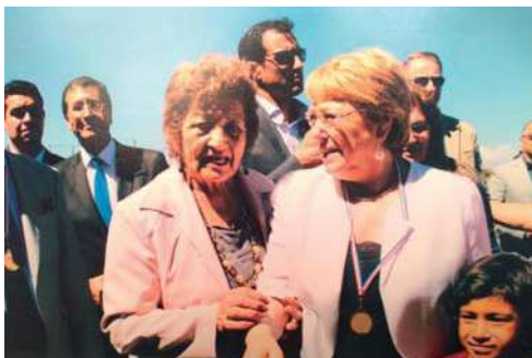
También estuvo junto a la expresidenta Michelle Bachelet.

Aquí, en su tierra natal, se mueve todo el día y señala: "así seguiré hasta que a la carretilla se le acabe la cuerda". Agrega que crió nueve niños, seis de su matrimonio y tres de su actual pareja, con la que lleva 40 años luchando codo a codo: "No ha sido fácil, pero nací para luchar y todo lo que tengo es fruto de mi trabajo; soy una mujer activa y no me gusta eso que ¡Aquí te las traigo Peter...!