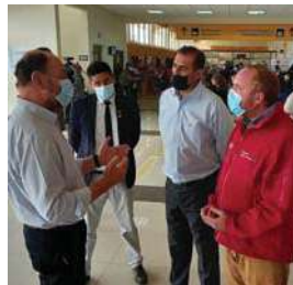
Ministro Alfredo Moreno junto al intendente Pablo Herman, el diputado Sergio Gahona y el seremi Pedro Rojas Oñfray.

ridad a líneas aéreas, pasajeros y usuarios del aeropuerto. Lo anterior busca entregar a la Región de Coquimbo un aeropuerto regional con carácter internacional.