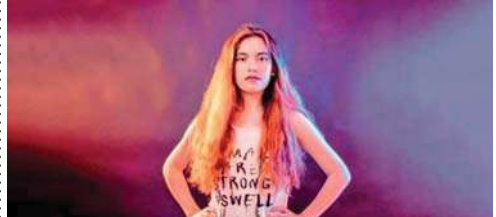
La joven continúa sorprendiendo a sus seguidores con nuevo material.

Pronto estará disponible en las principales plataformas de música online.