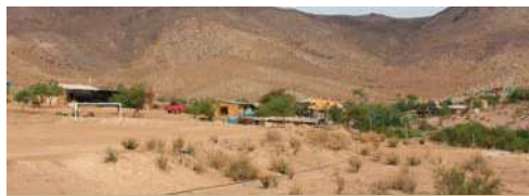
Un paisaje típico de La Jarilla y Azogue.