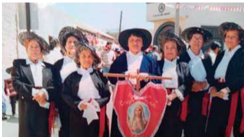
No solo es bailarina de los Chunchos de Andacollo, también participa en agrupaciones de adultos mayores.

que no hablaba, me gritó: ¡Mamá, guagua! Y apuntó a una muñeca que tenía en el living. Y ahí comenzó todo. Trabajé rápido y el 28 de septiembre del 1969 fundé el baile Chunchos de Andacollo, de Chuqui, y el 23 de diciembre de ese año llegué a Andacollo con dos micros repleta a bailar a la Virgen para cumplir lo prometido".